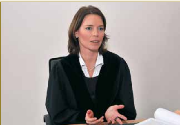
Führt durch den Prozess: die deutsche Richterin. La procédure se déroule sous la direction du juge allemand.

Deutsche Gerichte arbeiten äußerst effizient und schnell: Bei den Amtsgerichten (Streitwert bis 5.000 Euro) sind in Deutschland über 50 Prozent der Verfahren binnen drei Monaten abgeschlossen. Am Landgericht (Streitwert über 5.000 Euro) ist jedes dritte Verfahren innerhalb von drei Monaten beendet und weitere 25 Prozent nach spätestens sechs Monaten.