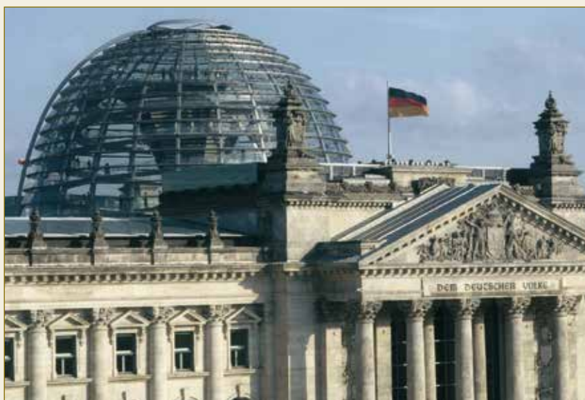
Law – Made in Germany: Der Deutsche Bundestag.

Als Unternehmer benötigen Sie gut ausgebildete Arbeitnehmer, eine leistungsstarke öffentliche Verwaltung, ein funktionierendes Bildungswesen, Straßen, Bahnhöfe und Flughäfen, vor allem aber auch eine funktionierende und berechenbare rechtliche Infrastruktur. Alle diese Rahmenbedingungen bietet Ihnen Deutschland in optimaler Weise.