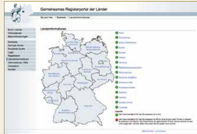
Für jedermann online zugänglich: das deutsche Handelsregister ( www.handelsregister.de ).

In Rechtsordnungen ohne zuverlässige Register muss die Vertretungsbefugnis von Gesellschaften regelmäßig von Anwälten überprüft und in so genannten Legal Opinions bescheinigt werden. Dies kann in den USA schnell bis zu fünfstelligen Dollarbeträge kosten.