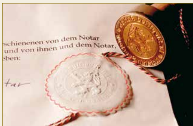
Die notarielle Urkunde: Damit kommen Sie schneller zum Ziel.

Ein Wettbewerber berichtet über angebliche Zahlungsschwierigkeiten der NRR MedTech GmbH.