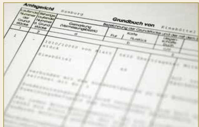
Toute information sur les propriétaires et les hypothèques de biens fonciers figurent dans le livre foncier moderne et électronique: fiable et sûr!

Enfin, par la lettre de gage la juridiction allemande met à la disposition des banques un moyen de refinancement internationalement reconnu et particulièrement sûr.