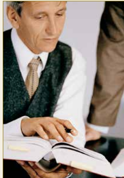
Juristes allemands: experts en rédaction de contrats.

Le droit en matière de contrats d'ouvrage explicitement réglé dans le Code civil offre aux rédacteurs de contrats des règles claires tenant compte des intérêts des parties, à partir de la passation de marchés jusqu'à la réception et de surcroît à l'égard d'éventuels