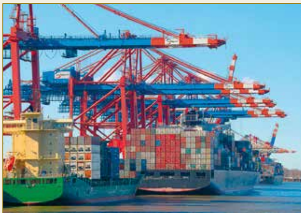
Gerade im internationalen Handel ist ein verlässliches Rechtssystem unerlässlich. Un système juridique fiable est indispensable, notamment pour le commerce international.

Sicherungseigentum und Eigentumsvorbehalt sichern den Kreditgeber, obwohl er nicht oder nicht mehr im Besitz der Sache ist. Hier zeigt sich das deutsche Recht erheblich flexibler und effizienter als andere Rechtsordnungen, die Sicherungsrechte immer vom Besitz der Sache abhängig machen.